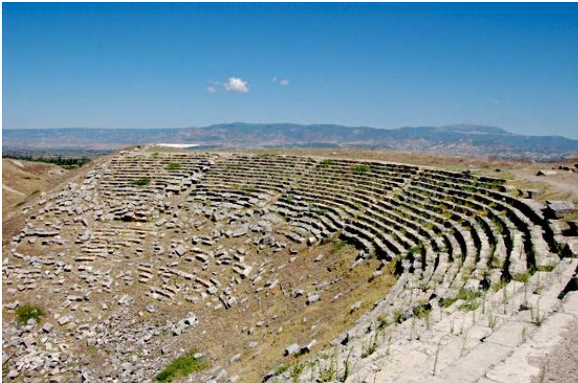
Piccolo teatro di Laodicea al Lico