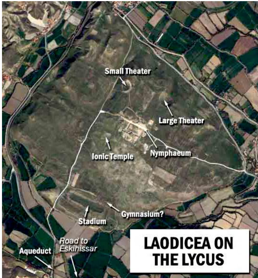
Il parco archeologico