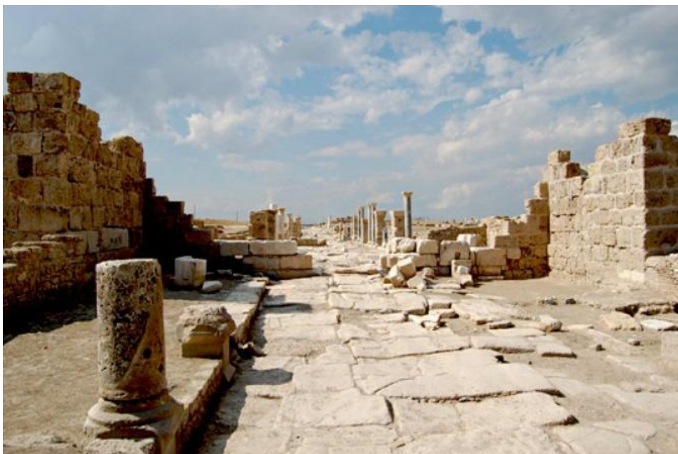
Strada colonnata di Laodicea al Lico