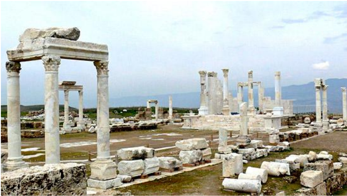
Il tempio A di Laodicea al Lico (Identificato con il Sebasteion: luogo di culto imperiale)