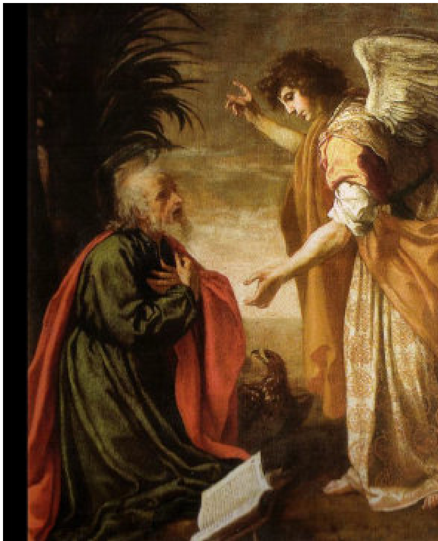
Jacopo Vignali, San Giovanni Evangelista a Patmos , 1642, Chiesa di San Gaetano, Firenze